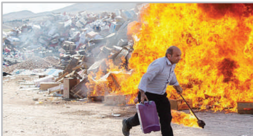
امحای بیش از ۱۳۰۰ تن کالای قاچاق