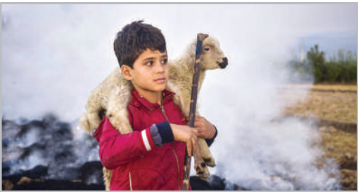
دامداری در روستاهای مازندران