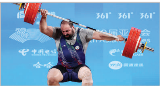
آخرین روز برگزاری نوزدهمین دوره بازی‌های آسیایی