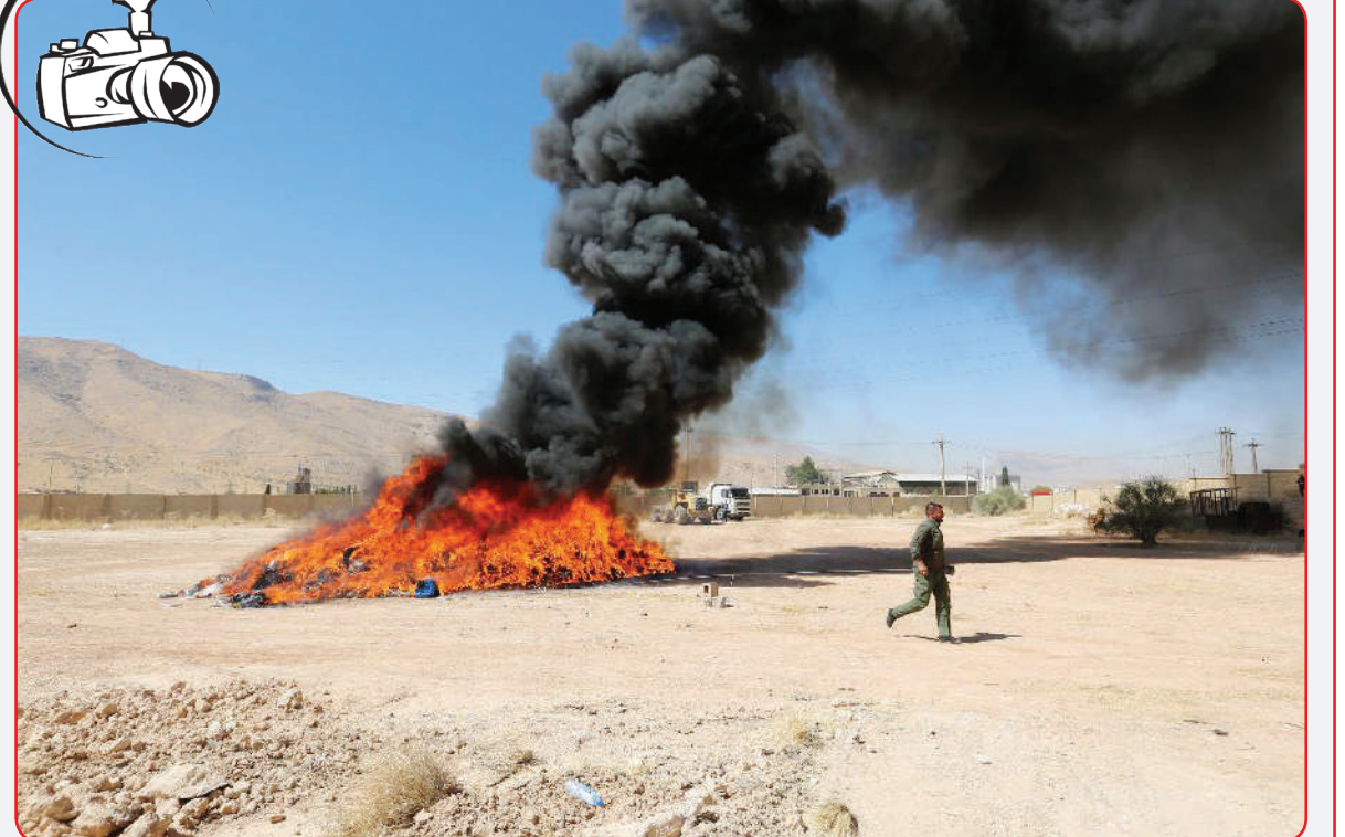
امحای بیش از ۱۱ تن مواد مخدر