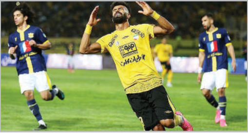
دیدار فوتبالی تیم‌های سپاهان اصفهان و صنعت نفت آبادان