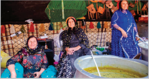
نمایشگاه «روستا آباد» - تهران